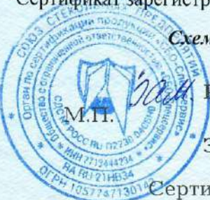
Схема сертификации 1с (ГОСТ Р 53603-2009)

Сертификат зарегистрирован на сайте СДС № РОСС RU.П2230.04СБН0 www.sbosspr.ru